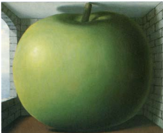
René Magritte (1898-1967): LA CHAMBRE D'ÉCOUTE III, 1958

Der skal også skabes rammer for fysisk udfoldelse, både til brugere og ansatte.