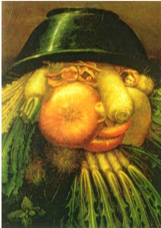
Giuseppe Arcimboldo (1527–1593), The Vegetable Gardener