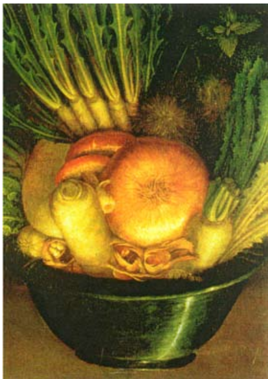
Giuseppe Arcimboldo (1527–1593), The Vegetable Gardener